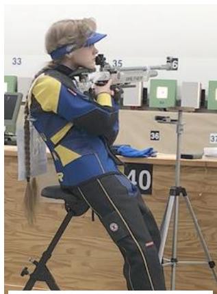
高い椅子での立射

射撃は道具を使うスポーツですので、一定の装備を準備する必要があります。種目にもよりますが、ライフル種目では、（１）銃、（２）銃に付属するアクセサリ類、（３）射撃コート、