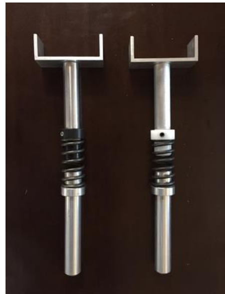
SH2 クラスのライフル支持スタンド(左(黒いパーツ)が強いスプリング(b)、右(白いパーツ)が弱いスプリング(a)のスタンド)

たいので、IPCでは対象とならない内部障害などや肢体不自由で障害の程度が国際的な判定で該当しない方も、国内の大会(国際大会の選考会などを除く)に参加できるようにしています。