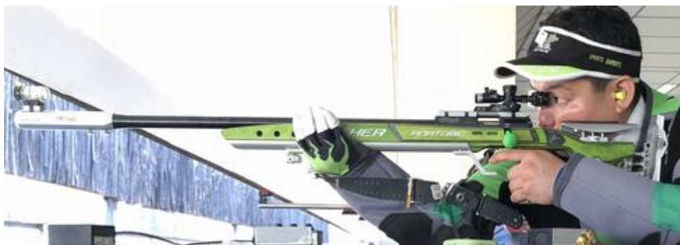
スモールボアライフル

ライフル種目をスタートする時には、立射と伏射のどちらから始めようかという選択についても考えるところです。自身の障害の状態や競技活動に使える時間などをよく踏まえて決めてください。パラ射撃の指導者や経験者とよく相談することをお勧めします。