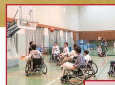
車いす バスケットボール