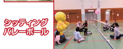
シッティング バレーボール