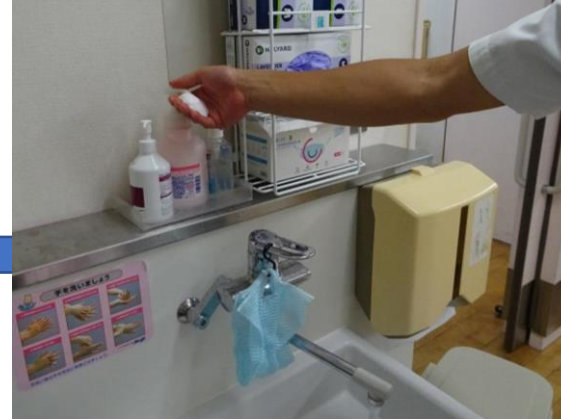
③たっぷりと石鹸や泡をつけます