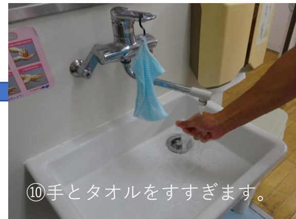
⑩手とタオルをすすぎます。