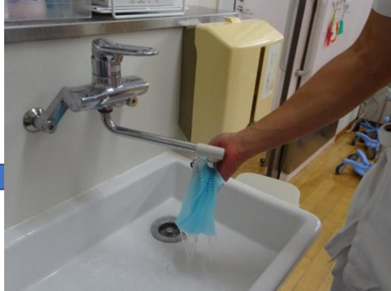
②タオルを濡らします。