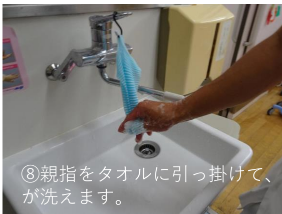
⑧親指をタオルに引っ掛けて、 ⑨爪と指の間も洗います。