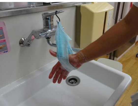
⑤タオルの中に手を入れ、手首を回転させて全体を洗います。