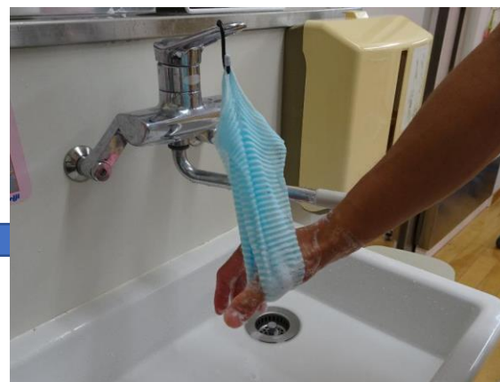
⑥親指をしっかりと洗います。