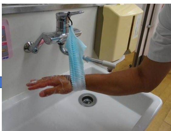
⑤手首もしっかりと洗います。