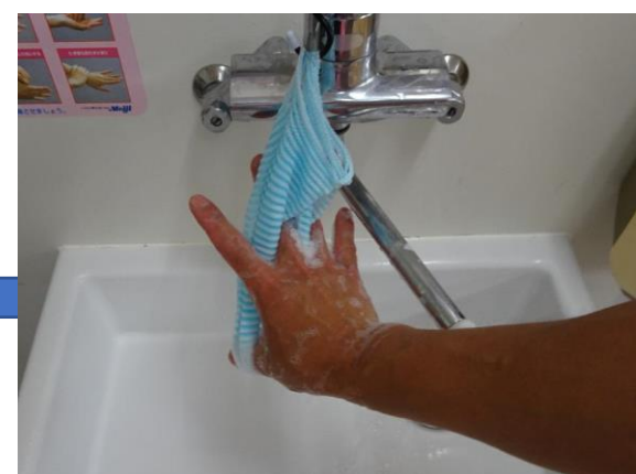
⑦指の間を洗います。