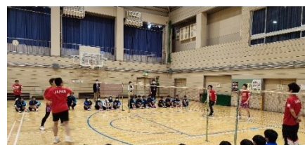
実施イメージ