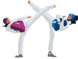
テコンドー (キョルギ(組手)、プムセ(型))