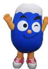
ふじっぴー 静岡県 イメージキャラクター