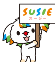
SUSIE（スージー） 東京都スポーツ文化事業団 マスコットキャラクター