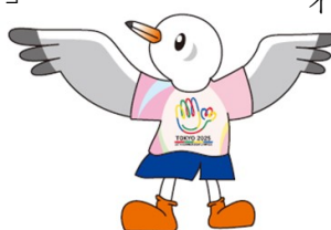
ゆりーと 東京都2025デフリンピック 公式マスコット

東京2025デフリンピック応援隊及び東京2025デフリンピック公式マスコットの詳細については、同日報道発表「各地のキャラクターによる東京2025デフリンピック応援隊を結成～各地のキャラクターがデフリンピックを盛り上げる！～」をご覧ください。