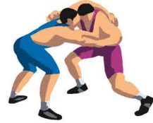
レスリング (フリースタイル、グレコローマン)