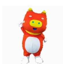
ふくしまを応援する 「ベコ太郎」