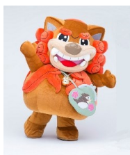
ふちゆこま 府中市 マスコットキャラクター

東京2025デフリンピック応援隊の結成・東京2025デフリンピック公式マスコットの任命式を行います。当日は、応援隊として以下のキャラクターが駆け付けます。